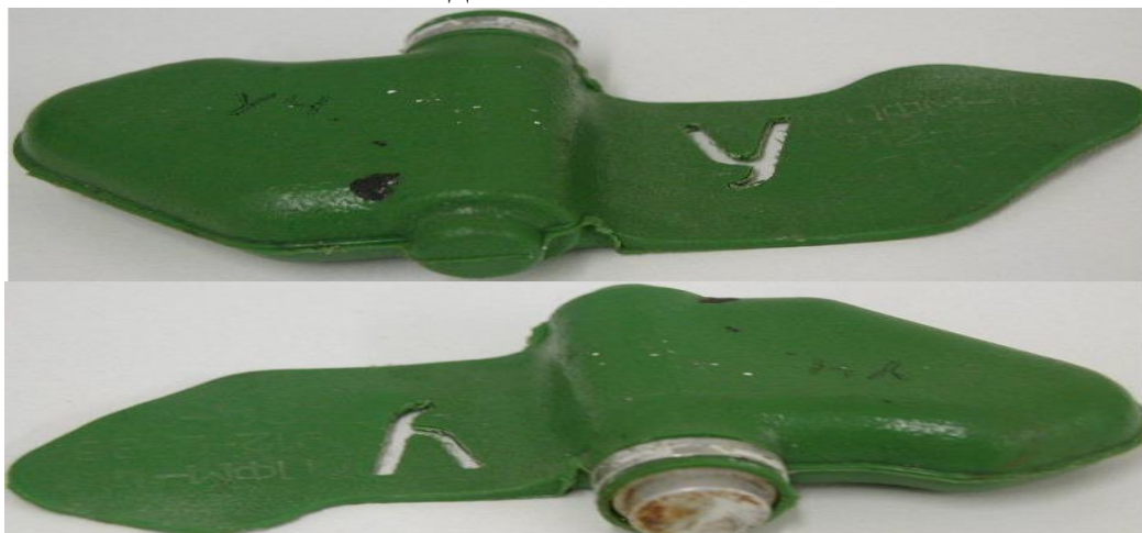
Внешний вид « Мины – ЛЕПЕСТКА »:

Масса мины 80 грамм, размеры – 12 x 6 сантиметров, чувствительность мины лежит в пределах 5-25 кг, что вполне достаточно для срабатывания от веса маленького ребенка.